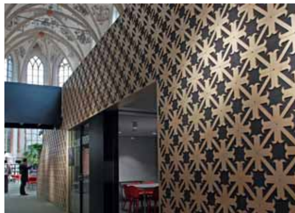
FOTO BOVEN Het entresol werd gestript en visueel losgemaakt van de bestaande architectuur. De kasten beneden lopen visueel door naar boven.

De architecten werkten steeds vanuit het oorspronkelijke monument: "Dat wilden we weer prominent maken. De vaak markante pilaren zijn weer goed zichtbaar. De afrastering van de entresol is neutraal: zwart en transparant. De boekenkasten hebben we strategisch en symmetrisch gepositioneerd. Ze staan weer zoveel mogelijk los van de oude architectuur. Door een