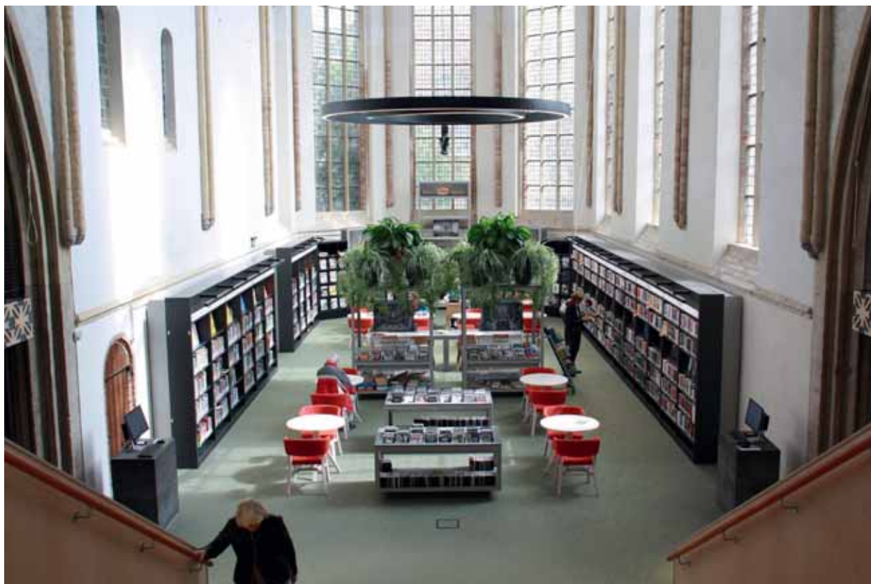
FOTO RECHTSONDER Overal zijn individuele lees- en werkplekken gecreëerd.

ontmoeting. De organisatie stimuleert de persoonlijke ontwikkeling van haar gebruikers en hun maatschappelijke kansen. Om dit te bereiken werkt zij samen met uiteenlopende partners op het terrein van taal en lezen, cultuur, educatie en welzijn.