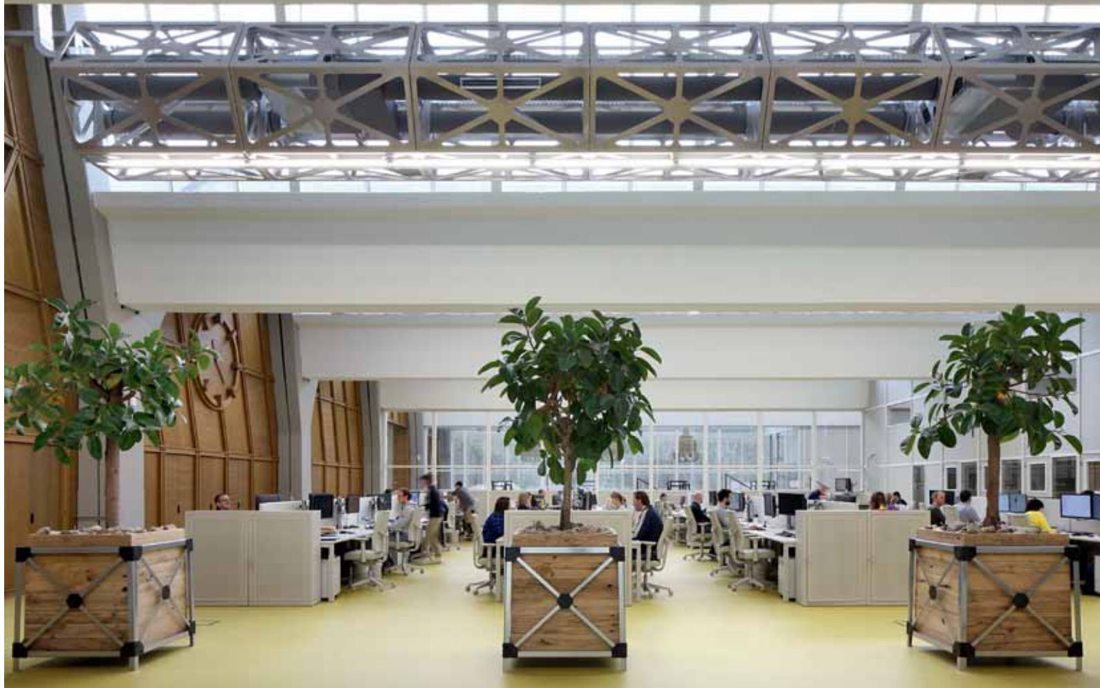
FOTO BOVEN Zicht op de nieuw ontworpen, groene kantoorruimte.