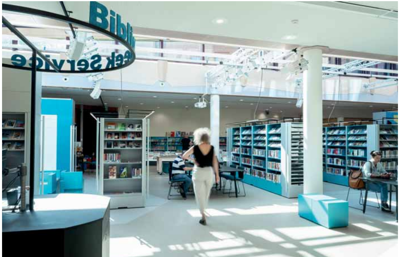
FOTO RECHTSONDER De bibliotheek, gezien vanaf het theaterpodium; de zijkanten van de 'kastblokken' dienen voor display, het raadplegen van catalogi en dergelijke.

FOTO RECHTSBOVEN De bar is ontworpen rond een muur die niet kon worden weggebroken. De segmenten boven en beneden spiegelen elkaar.