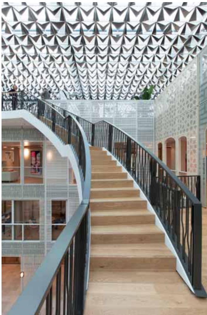
FOTO LINKSBOVEN Deel van de dynamische trap in het atrium. In de achtergrond de witte gevelpanelen in geperforeerd staal, waarvoor de medewerkers ontwerpen aandroegen.