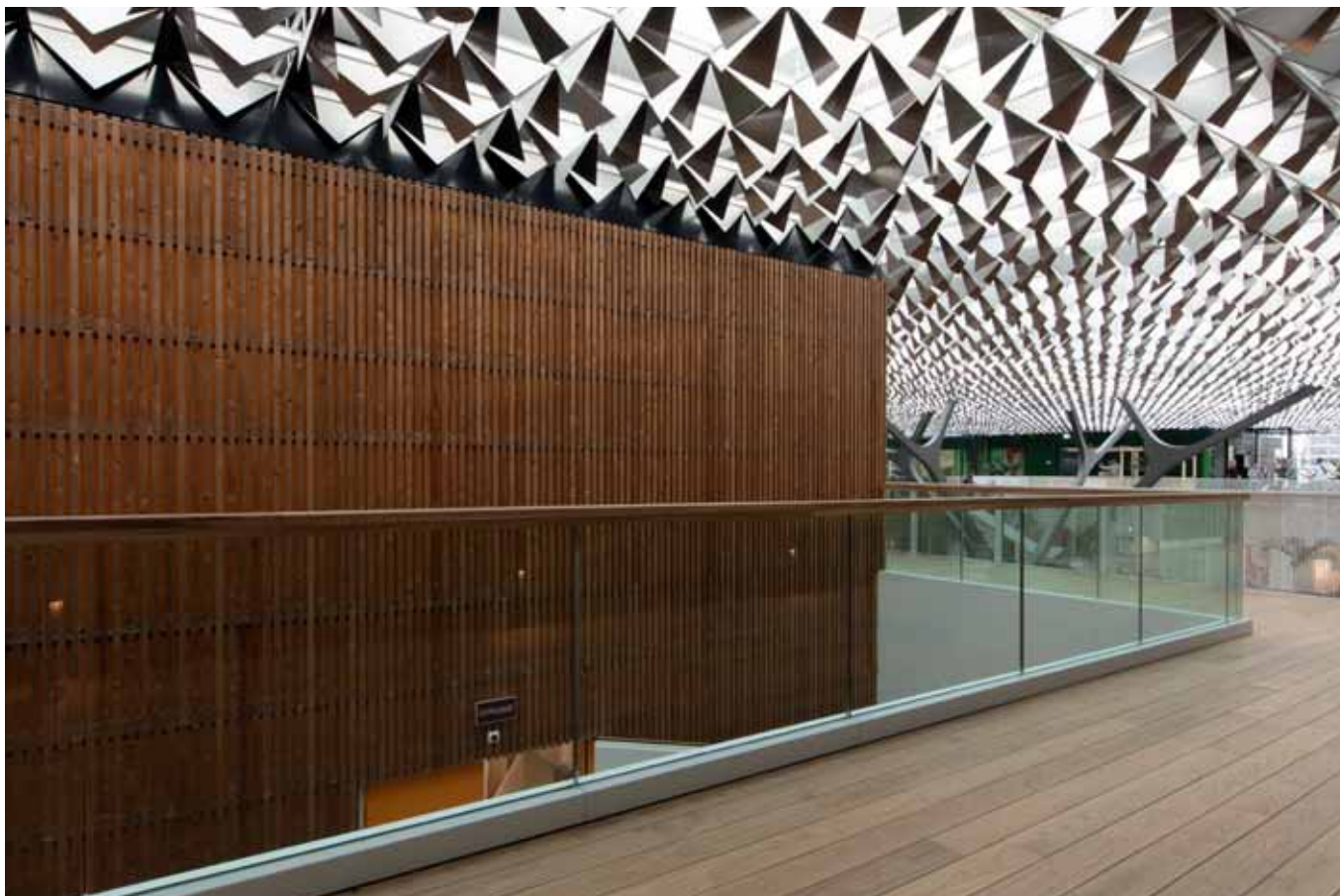
FOTO BOVEN Detail van de aluminium panelen van het bladerdak. Deze zijn op zeven verschillende manieren opgevouwen zodat het invallend licht steeds verandert.