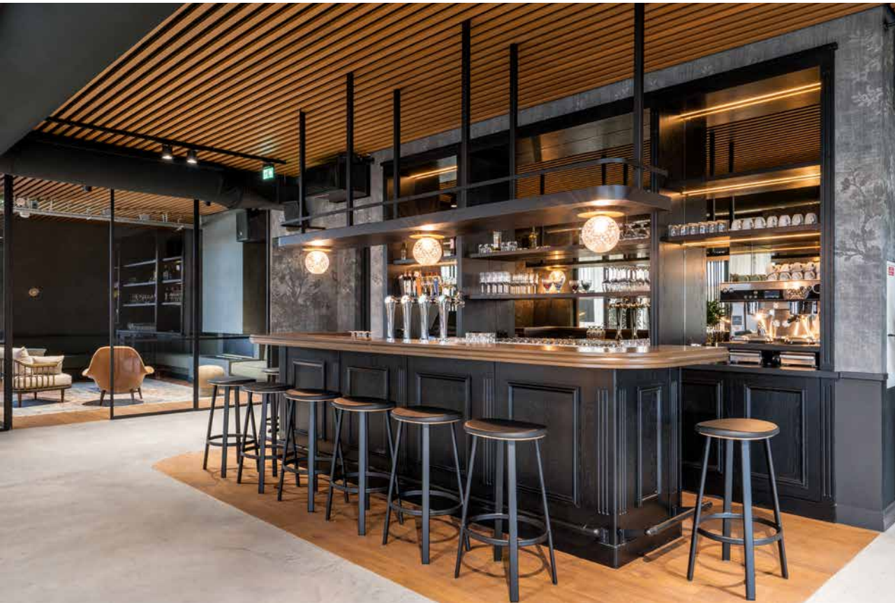
FOTO BOVEN In de directiebar van Technoforum heerst de sfeer van een herensociëteit. Een huiselijke bibliotheek, comfortabele fauteuils en een open haard zorgen voor een stemmige intimiteit.

FOTO MIDDEN De rechte hoeken in de kantoren zijn bewust afgerond, net als het witte betonstuc in de entree. Zij bevorderen een soepeler doorstroming en onderlinge communicatie.