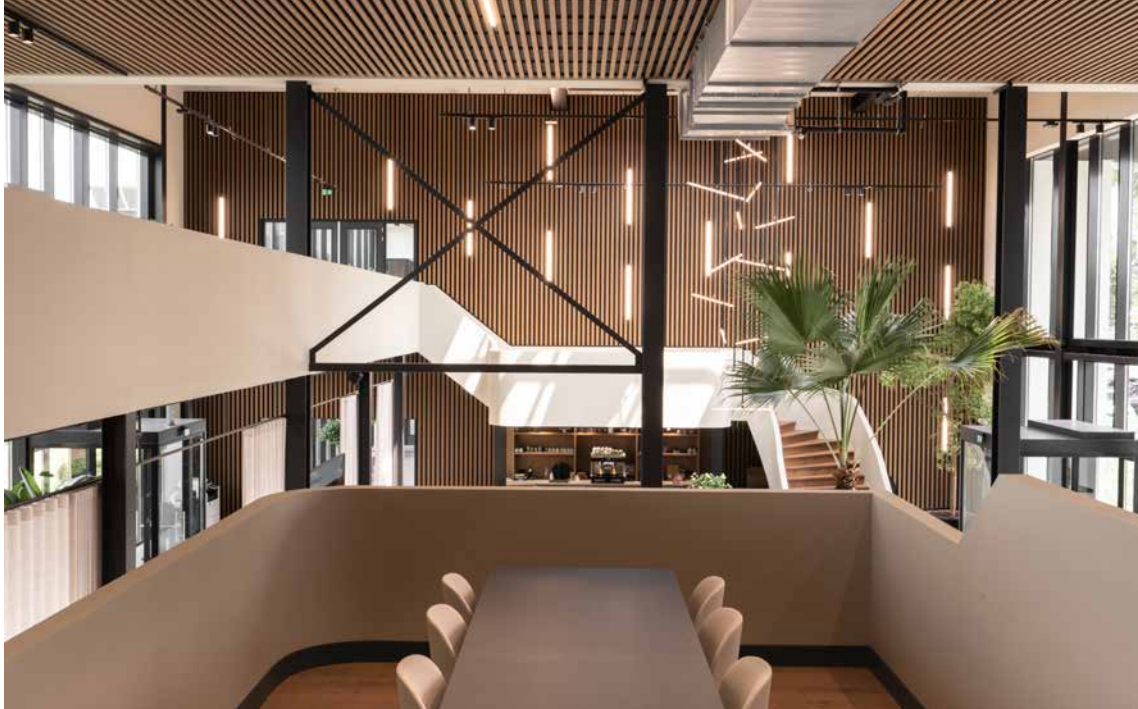
FOTO BOVEN Zicht vanaf de vergaderunit op de eerste verdieping. Een op maat ontworpen 'kroonluchter' van lichtbuizen doorbreekt de hoogte en contrasteert speels met de verticale lichtaccenten in de houten achterwand en de plafonds.