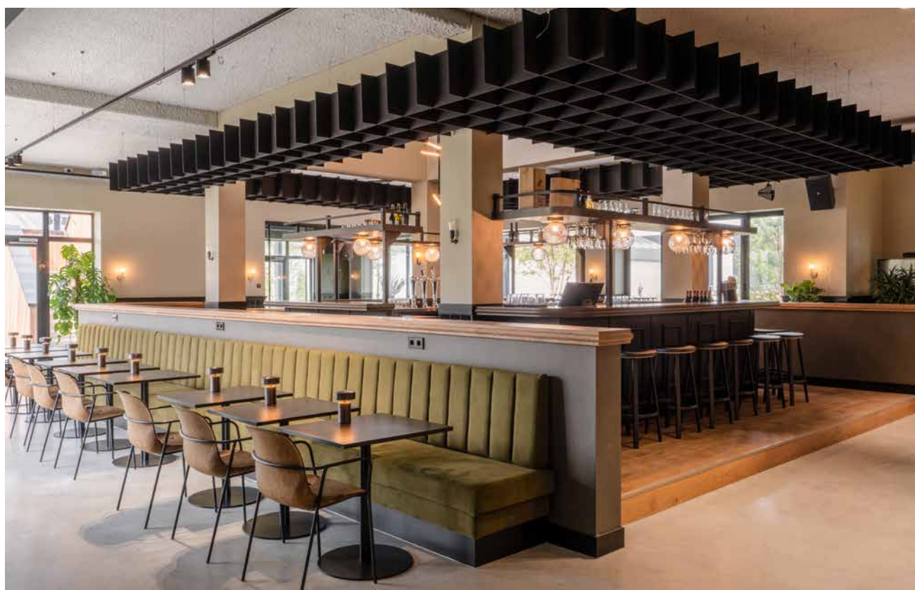
FOTO ONDER Boven de bar in het restaurant hangt een speciaal ontworpen, decoratief raster van zwart vilt dat de akoestiek verbetert.

FOTO MIDDEN Het restaurant is volledig ingericht op ontmoeting. Je kunt er eten aan tweepersoonsstafeltjes, maar ook aan groepstafels of op een kruk aan de bar. Je kunt je terugtrekken in nissen en bij mooi weer op een van de buitenterrassen.