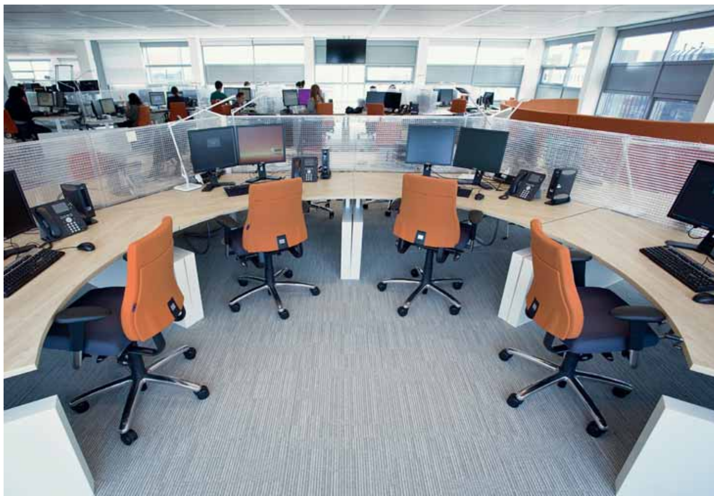
FOTO BOVEN Een Achmea call-centre met op de vloer de speciaal ontwikkelde vloerbedekking van Interface tapijttegels