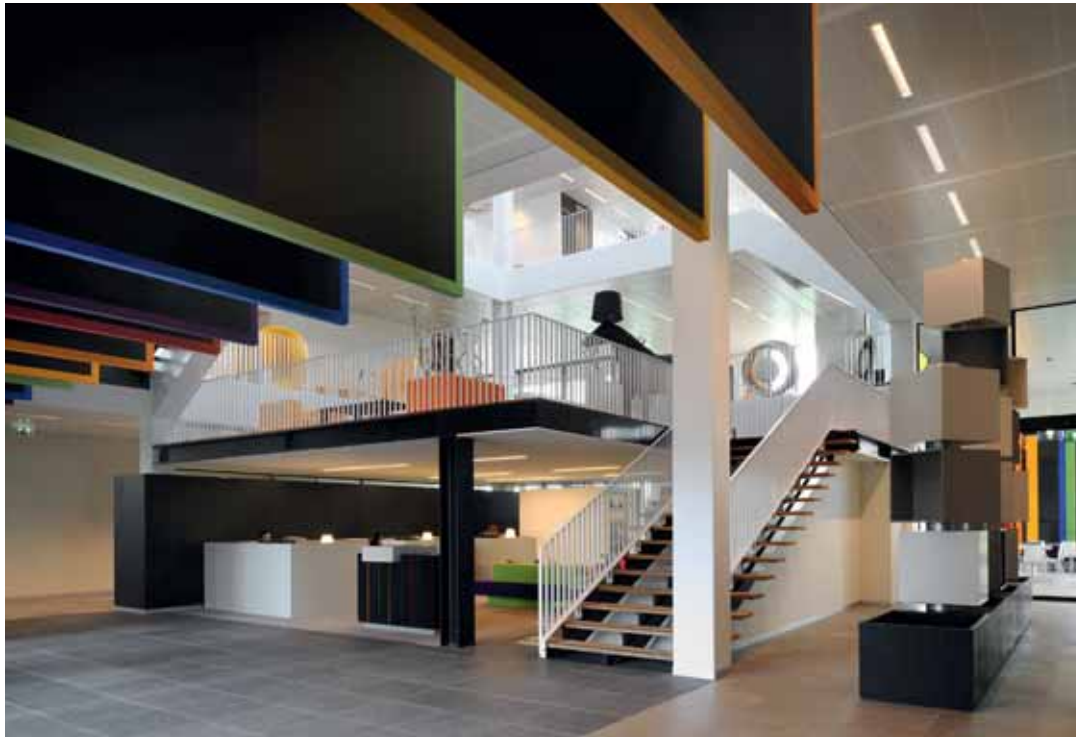
FOTO BOVEN Etreebalie en receptie. Aan het plafond akoestische, textiele kleurbanen