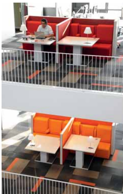
FOTO BOVEN LNKS Cockpits met in hoogte verstelbare tafels