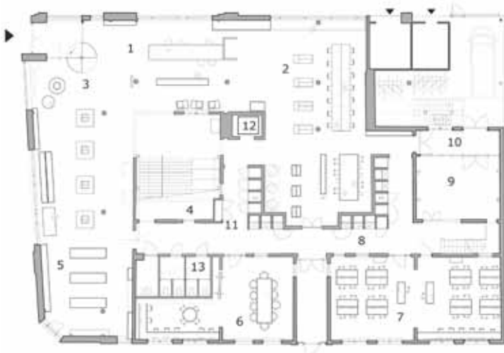
BEDEDE GROND 1. informatiebureau 6. historische historische vereniging 11. toilet 2. multifunctie, computerlab 7. consument 12. lift 3. entreehal 8. bibliotheek in nieuw 13. toegangs 4. entreehal 9. educatieve dienst 5. collectiehuur 10. woonruimte