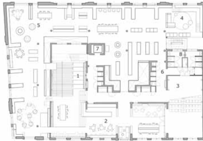
1E VERDIEPING 1. publieke tribune 5. collectie 2. woonruimte 6. bibliotheek 3. auditorium Zaal 7 7. lift 4. bibliotheek 8. toegangs