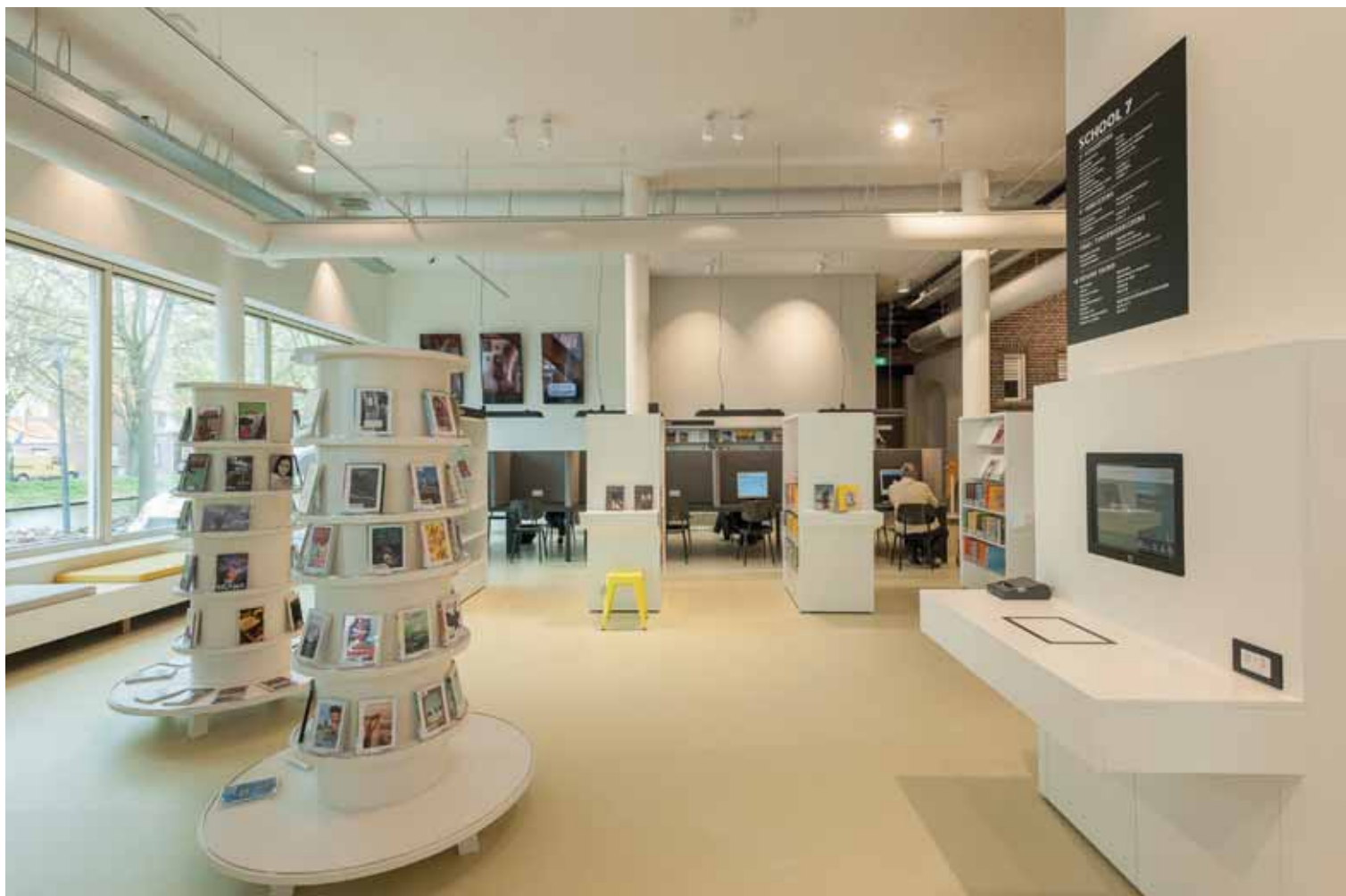
FOTO BOVEN Het interieur is overal ruimtelijk en open gehouden.