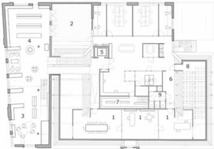
2E VERDIEPING 1. bibliotheek 6. bibliotheek 2. bibliotheek 7. bibliotheek 3. collectie bibliotheek 8. Zaal 7 4. lift en trappen 9. toegangs 5. lift